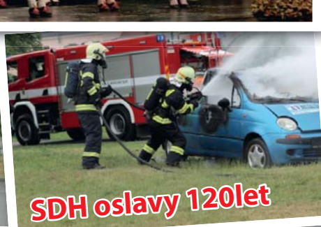
SDH oslavy 120let