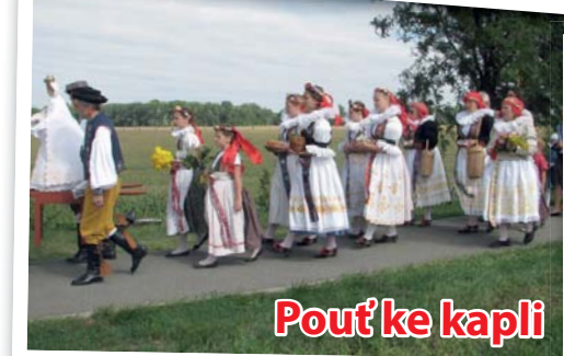
Pouť ke kapli