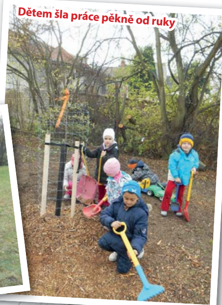
Dětem šla práce pěkně od ruky