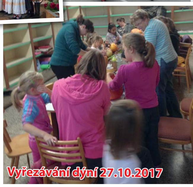
Vyřezávání dýní 27.10.2017