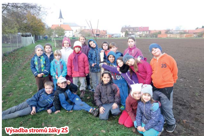
Výsadba stromů žáky ZŠ