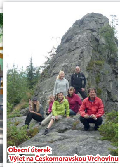
Obecní úterek Výlet na Českomoravskou Vrchovinu