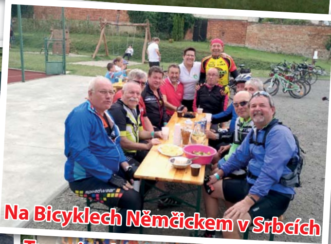
Na Bicyklech Němčickem v Srbcích