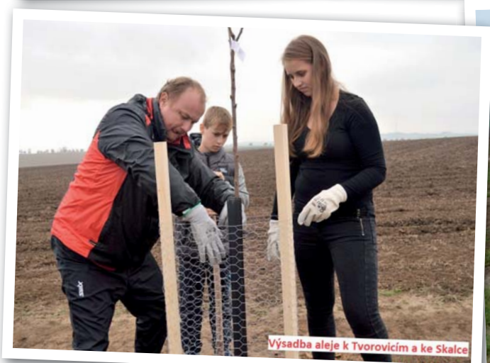
Výsadba aleje k Tvorovicím a ke Skalce