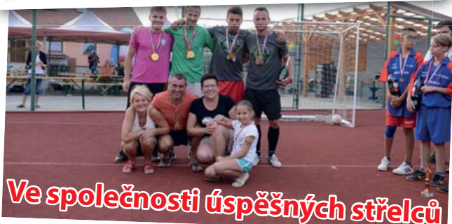
Ve společnosti úspěšných střelců