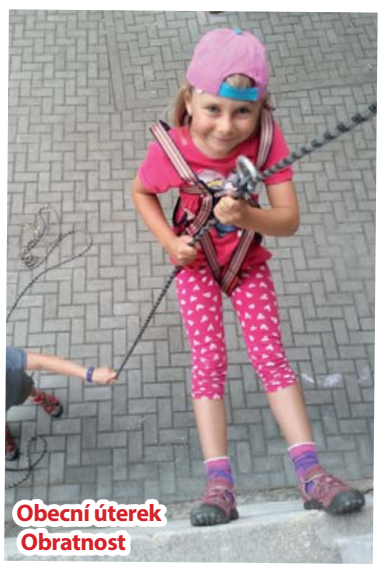
Obecní úterek Obratnost