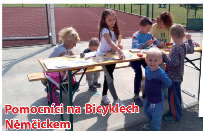
Pomocníci na Bicyklech Němčickem