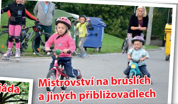
Mistrovství na bruslích a jiných přibližovadlech