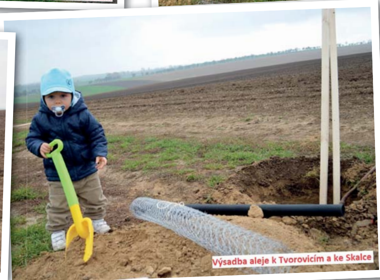
Výsadba aleje k Tvorovicím a ke Skalce