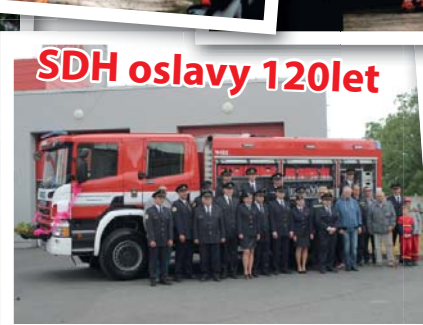
SDH oslavy 120let