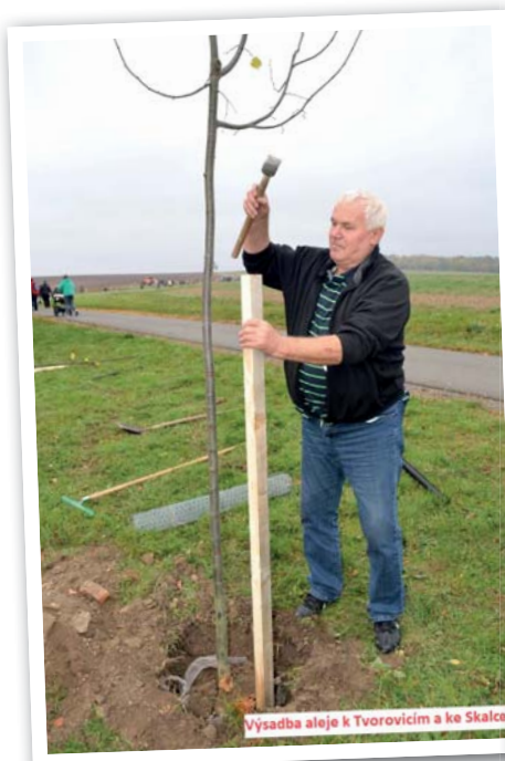
Výsadba aleje k Tvorovicím a ke Skalce

Spokojené, láskou a porozuměním naplněné vánoční svátky, hodně zdraví, štěstí a úspěchů v novém roce 2018 přeje kolektiv pracovníků Obecního úřadu Pivín.