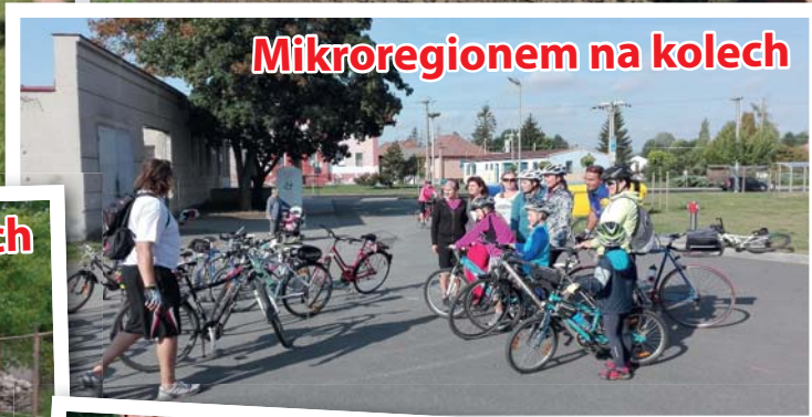
Mikroregionem na kolech