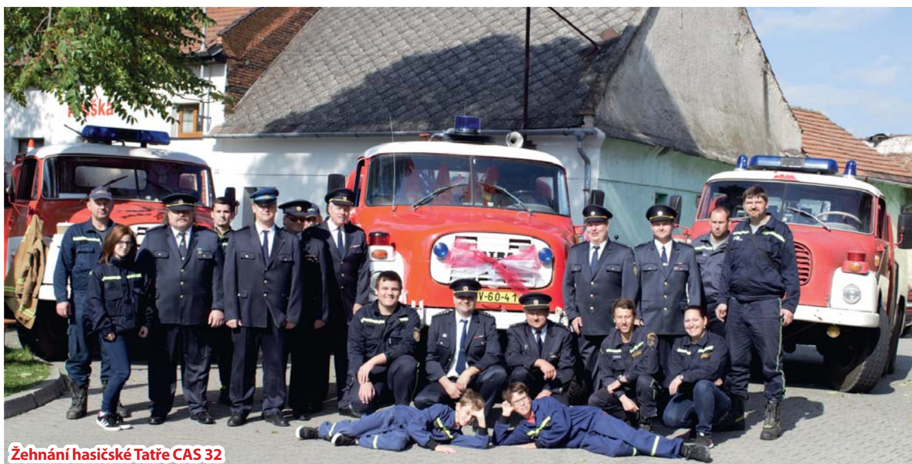
Žehnáni hasičské Tatre CAS 32