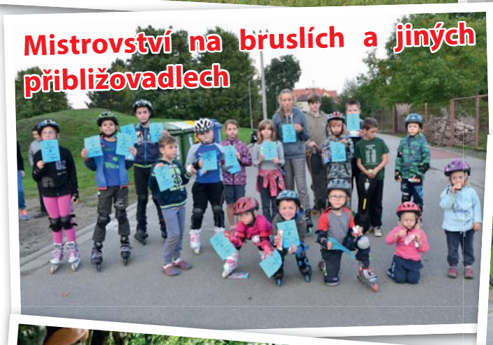
Mistrovství na bruslích a jiných přibližovadlech