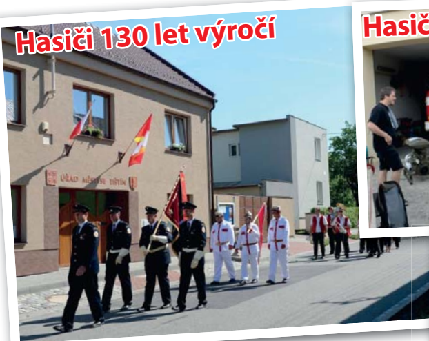
Hasiči 130 let výročí