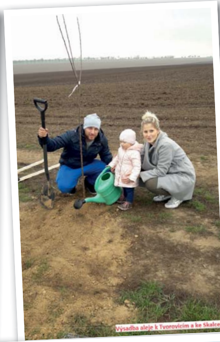
Výsadba aleje k Tvorovicím a ke Skalce