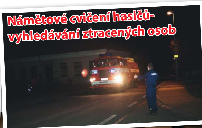
Námětové cvičení hasičů- vyhledávání ztracených osob