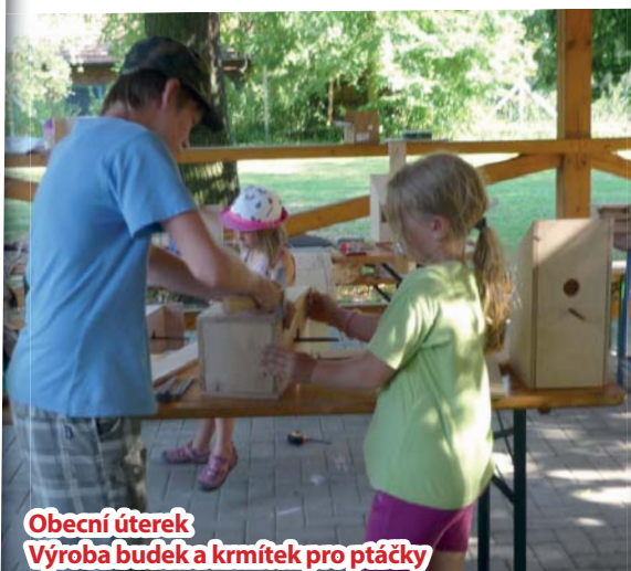
Obecní úterek Výroba budek a krmítek pro ptáčky