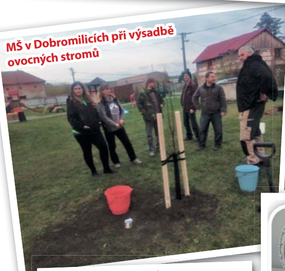
MŠ v Dobromilicích při výsadbě ovocných stromů