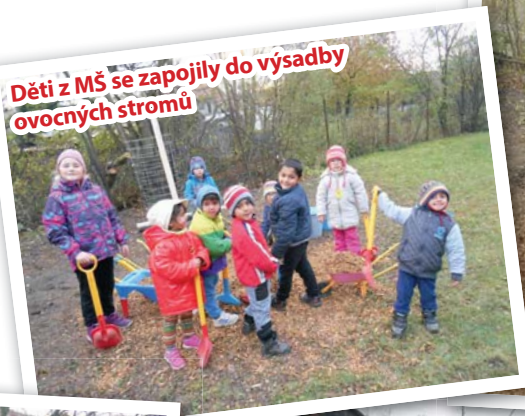
Děti z MŠ se zapojily do výsadby ovocných stromů