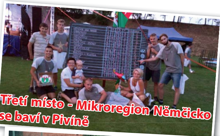
Třetí místo - Mikroregion Němčicko se baví v Pivíně