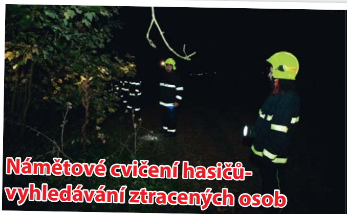
Námětové cvičení hasičů- vyhledávání ztracených osob