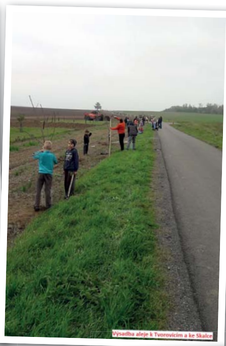
Výsadba aleje k Tvorovicím a ke Skalce