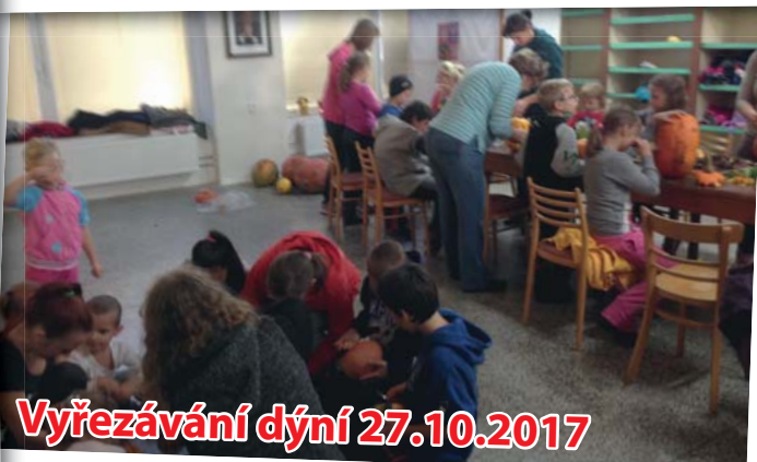
Vyřezávání dýní 27.10.2017