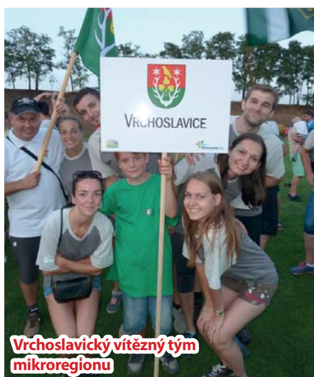
Vrchoslavický vítězný tým mikroregionu