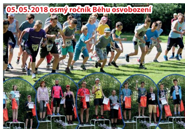
05. 05. 2018 osmý ročník Běhu osvobození