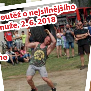
Soutěž o nejsilnějšího muže, 2. 6. 2018