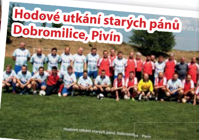
Hodové utkání starých pánů Dobromilice, Pivín