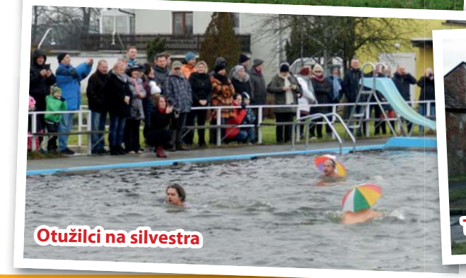
Otužilci na silvestra