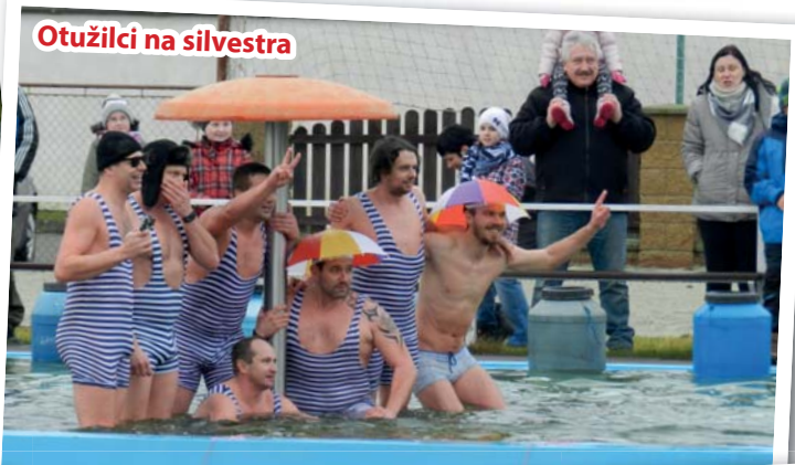
Otužilci na silvestra