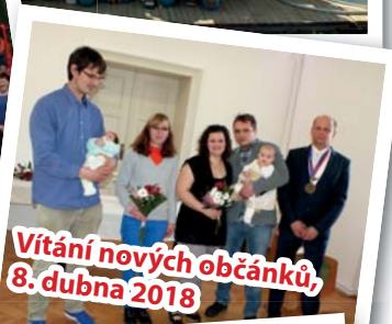
Vítání nových občánků, 8. dubna 2018