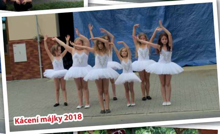
Kácení májky 2018