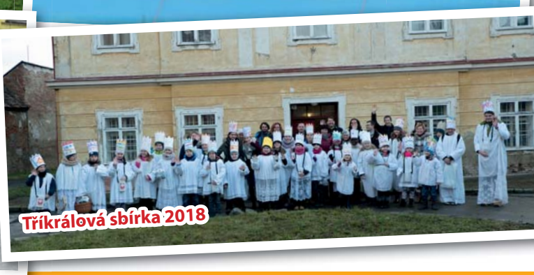
Tříkrálová sbírka 2018