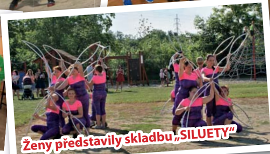
Ženy představily skladbu „SILUETY“