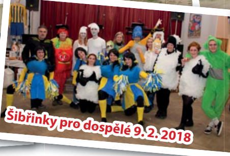
Šibřinky pro dospělé 9. 2. 2018