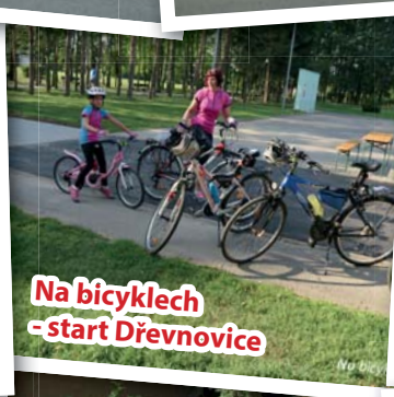
Na bicyklech - start Dřevnovice