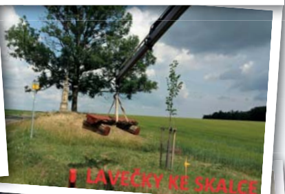
V LAVIČKY KE SKALEC