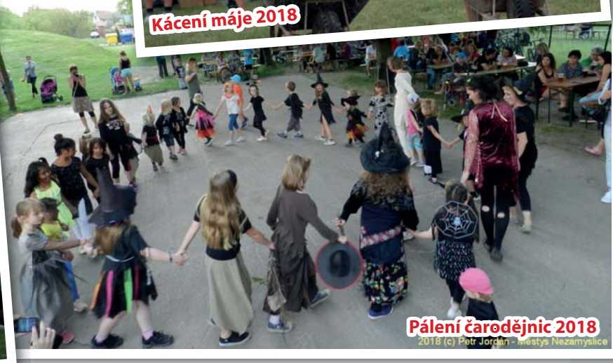
Pálení čarodějnic 2018

2018