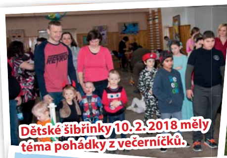
Dětské šibřinky 10. 2. 2018 měly téma pohádky z večerníků.