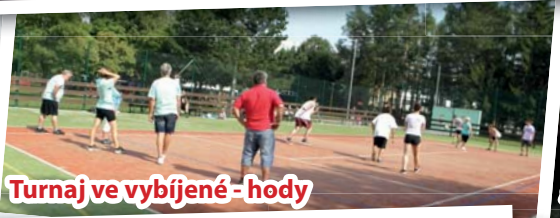
Turnaj ve vybíjené - hody