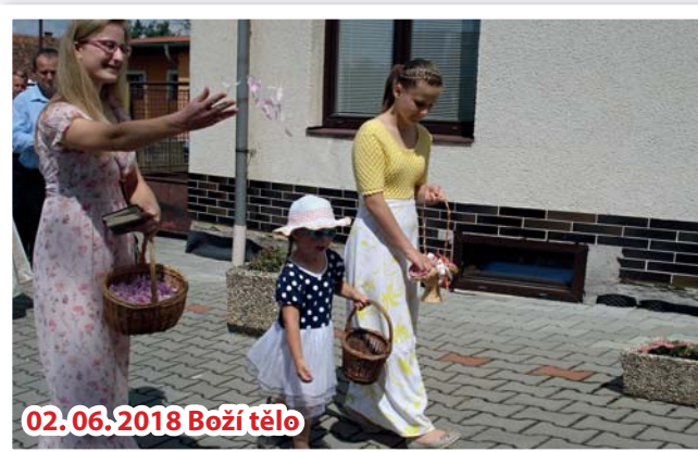
02. 06. 2018 Boží tělo