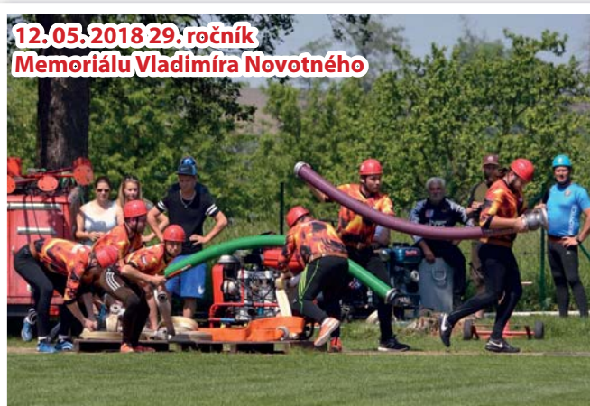
12. 05. 2018 29. ročník Memoriálu Vladimíra Novotného