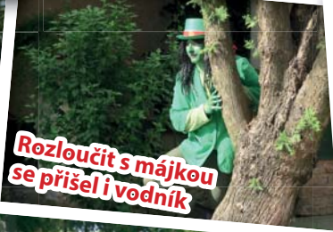
Rozloučit s májkou se přišel i vodník