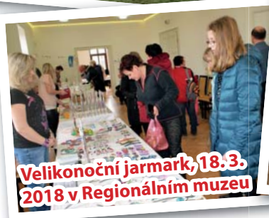
Velikonoční jarmark, 18. 3. 2018 v Regionálním muzeu