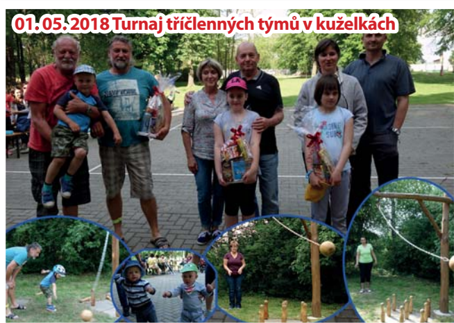
01. 05. 2018 Turnaj tříčlenných týmů v kuželkách