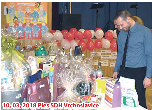
10. 03. 2018 Ples SDH Vrchoslavice