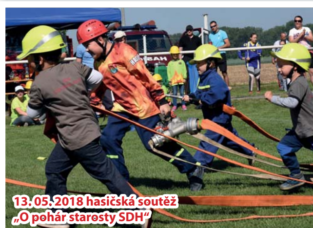
13. 05. 2018 hasičská soutěž „O pohár starosty SDH“