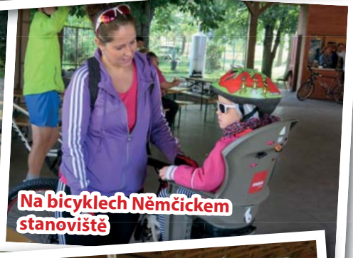
Na bicyklech Němčickem stanoviště