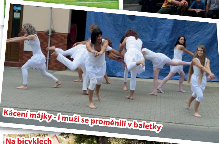
Kácení májky - i muži se proměnili v baletky