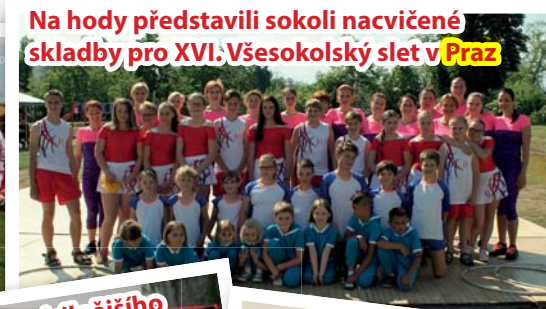
Na hody představili sokoli nacvičené skladby pro XVI. Všesokolský slet v Praze