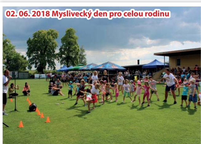
02. 06. 2018 Myslivecký den pro celou rodinu