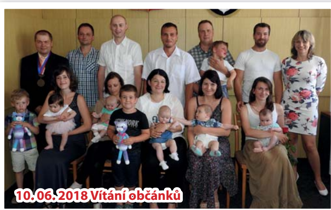
10. 06. 2018 Vítání občánků