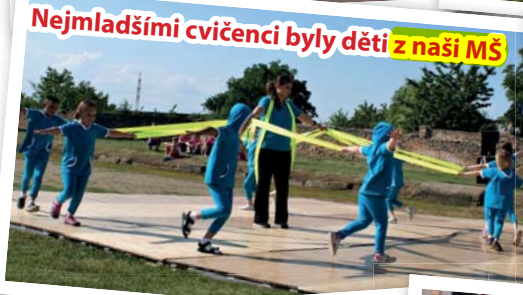
Nejmladšími cvičenci byly děti z naší MŠ