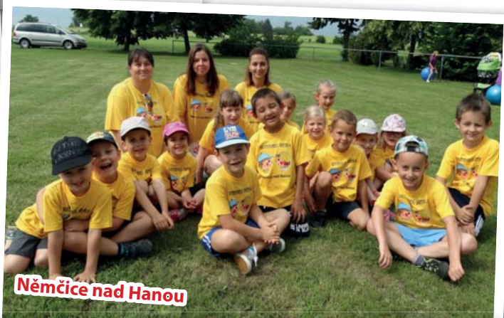
Němčice nad Hanou