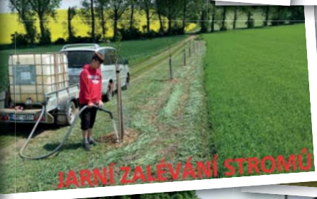
JARNÍ ZALEVÁNÍ STROMŮ