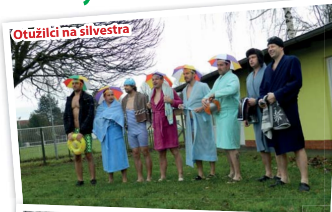
Otužilci na silvestra