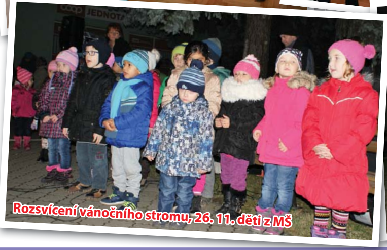
Rozsvícení vánočního stromu, 26. 11. děti z MŠ