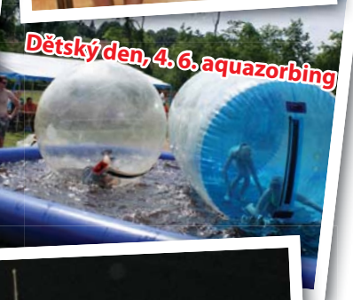
Dětský den, 4. 6. aquazorbíng