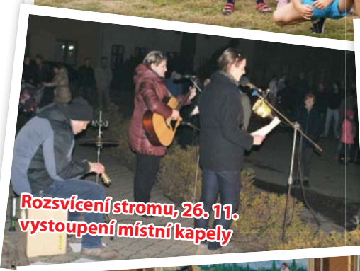
Rozsvícení stromu, 26. 11. vystoupení místní kapely