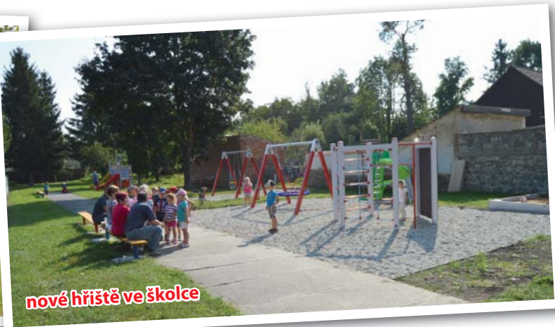
nové hřiště ve školce