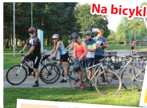
Na bicyklech Němcickem