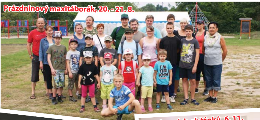
Prázdninový maxitáborák, 20. - 21. 8.