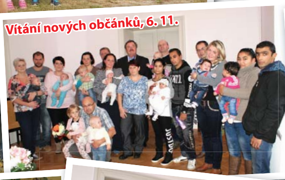
Vítání nových občánků, 6. 11.