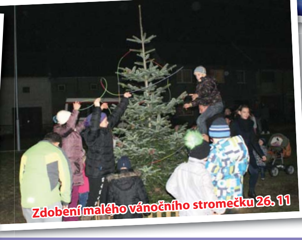
Zdobení malého vánočního stromečku 26. 11