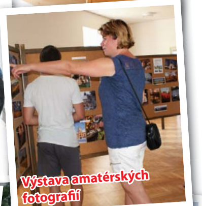
Výstava amatérských fotografií