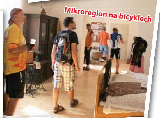
Mikroregion na bicyklech