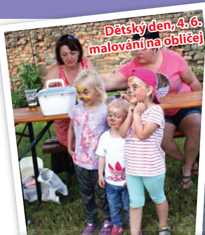
Dětský den, 4. 6. malování na obličeje