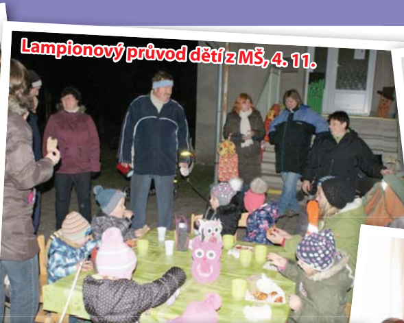
Lampionový průvod dětí z MŠ, 4. 11.