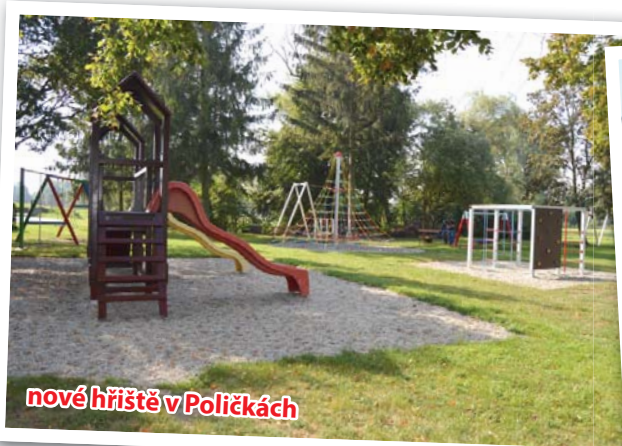
nové hřiště v Poličkách